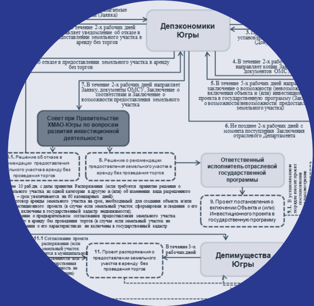
Схема предоставления земельных участков, находящихся в государственной или муниципальной собственности, юридическим лицам в аренду без проведения торгов для размещения объектов социально-культурного и коммунально-бытового назначения, реализации масштабных инвестиционных проектов в Ханты-Мансийском автономном округе – Югре